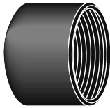
Filetage NPS * = filetage NPT