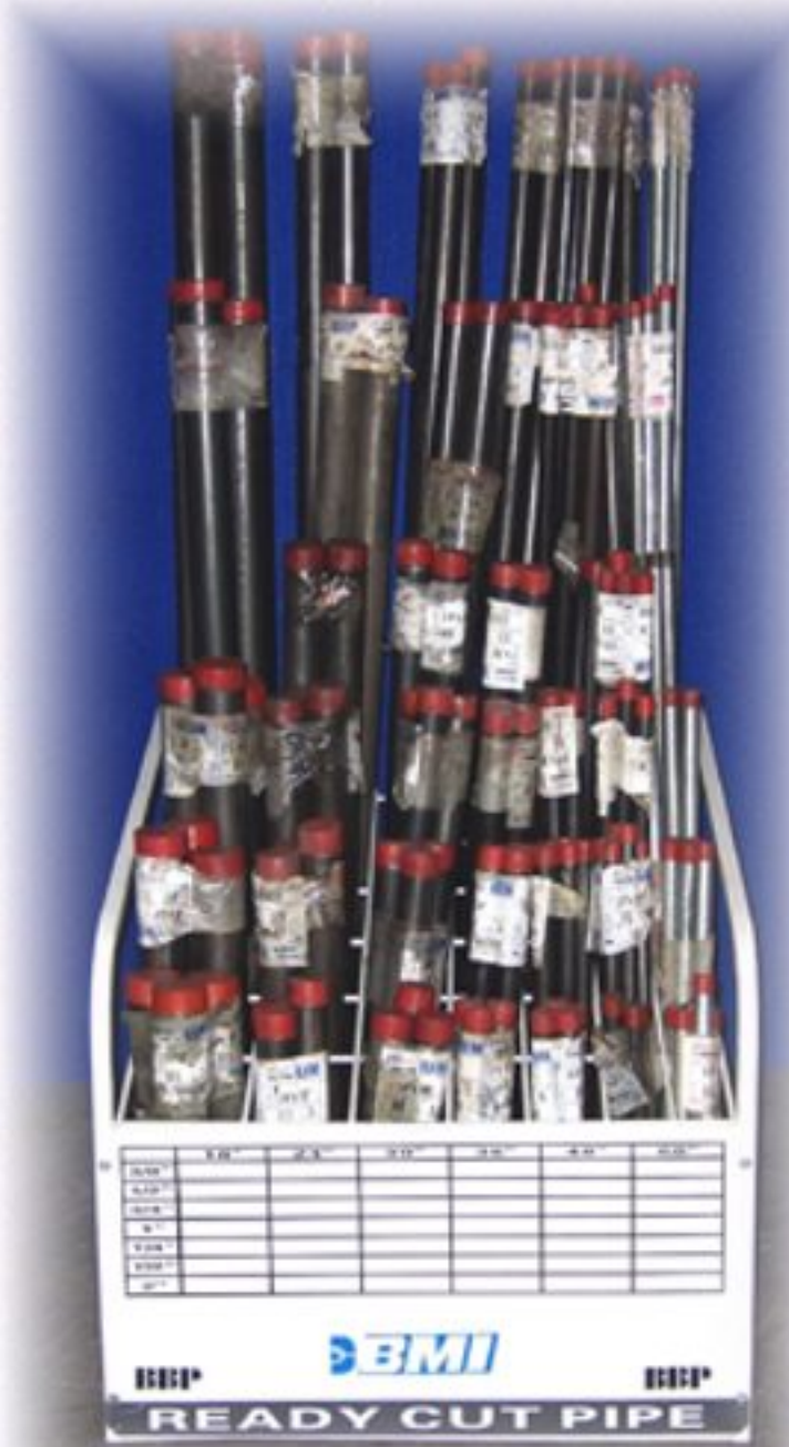
Présentoir pour Tuyaux pré-coupés